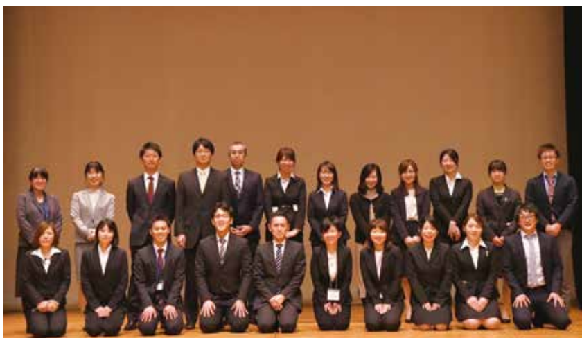
本学会の実行委員