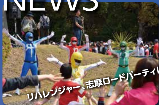
リハレンジャー、志摩ロードパーティに参上