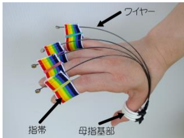
TABABE スパイダー (特許庁出願番号2013-001404)